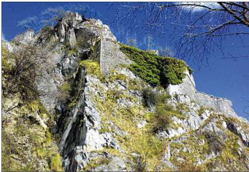
Las restanzas da la fortezza sco ellas sa preschentan oz.